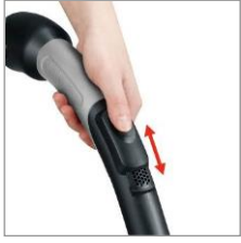
komfortabel: Ergo-Soft-Griff XL