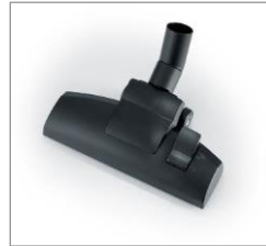
effizient: Wessel RD 277