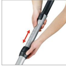
einfach: XL-Easy-Touch Teleskoprohr