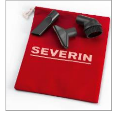
praktisch: 3er- Zubehörset